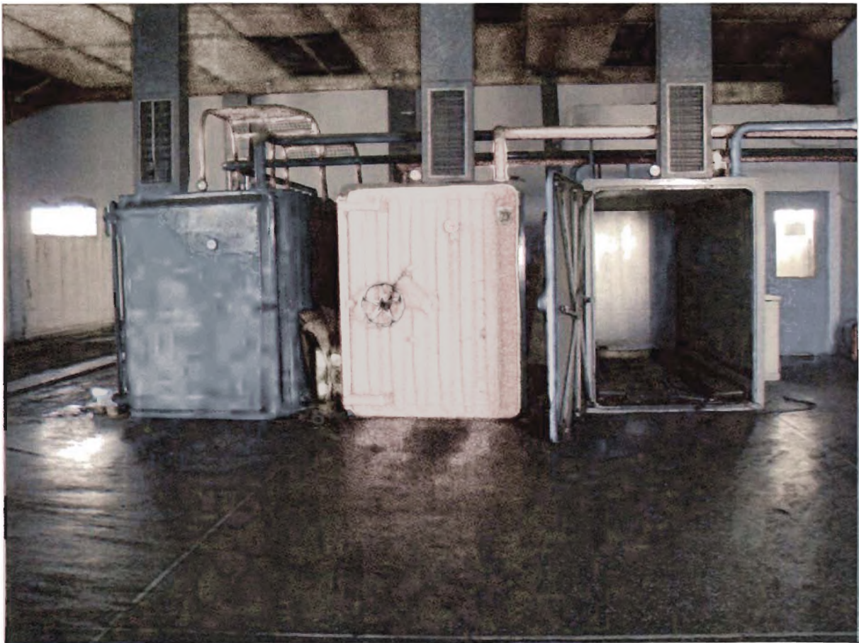
Εικόνα 4 Απεντομοτήριο

Με την απεντόμωση σκοπός είναι να σκοτωθούν τα έντομα που τυχόν υπάρχουν, χάρη στο Βρωμιούχο μεθύλιο και η υποπίεση που δημιουργείται σκάει τα αυγά των εντόμων που τυχόν έχουν τοποθετήσει μέσα στη σταφίδα τα έντομα.