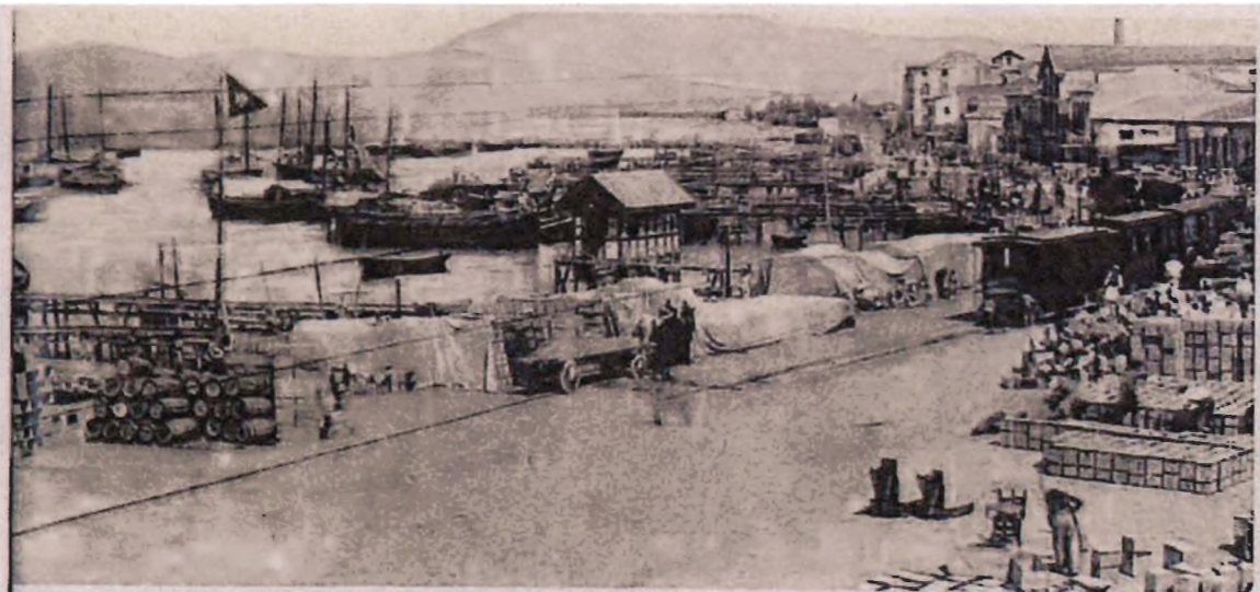
Εικόνα 1 Πάτρα- φόρτωση σταφίδας 1990

Η παραγωγή του 1867 ήταν πολύ μεγάλη, ενώ του επόμενου έτους χαρακτηρίζεται κανονική και ο γενικός μέσος όρος της τιμής της σταφίδας το 1868 έφθασε τις 107 δραχμές τα 1.000 ενετικά λίτρα και στη Πάτρα τις 130 δραχμές, τα δε καλλιεργητικά έξοδα σε 123 δραχμές ανά 1.000 ενετικά λίτρα πλέον τόκων, κ.λπ. ως εκ τούτου η συνέχιση της σταφιδοκαλλιέργειας καθίστατο πλέον ασύμφορη, λόγω υπέρ παραγωγής που μείωνε τις τιμές και μοναδική ελπίδα διαφαίνεται η συγκρατημένη μείωση της παραγωγής, οπότε, ενόψει της εξασφαλισμένης αγγλικής κυρίως αγοράς, θα προέκυπτε αύξηση των τιμών.