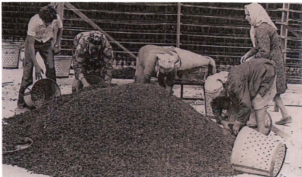
Εικόνα 3 Μάζεμα αποξηραμένης σταφίδας.

Για τη αποξήρανση της σταφίδας, οι ημερομηνίες είναι από 25 Αυγούστου μέχρι τις 20 Σεπτεμβρίου, για 10 ημέρες. Όμως πρέπει να σημειωθεί ότι μπορεί να ξεκινήσουμε την αποξήρανση νωρίτερα δηλ. από της 15 Αυγούστου ή αργότερα δηλ. στις 30 Αυγούστου, είναι ανάλογα δηλαδή με τον καιρό αν έχει μεγάλο καύσωνα ή αν έχει τύχει να βρέξει.