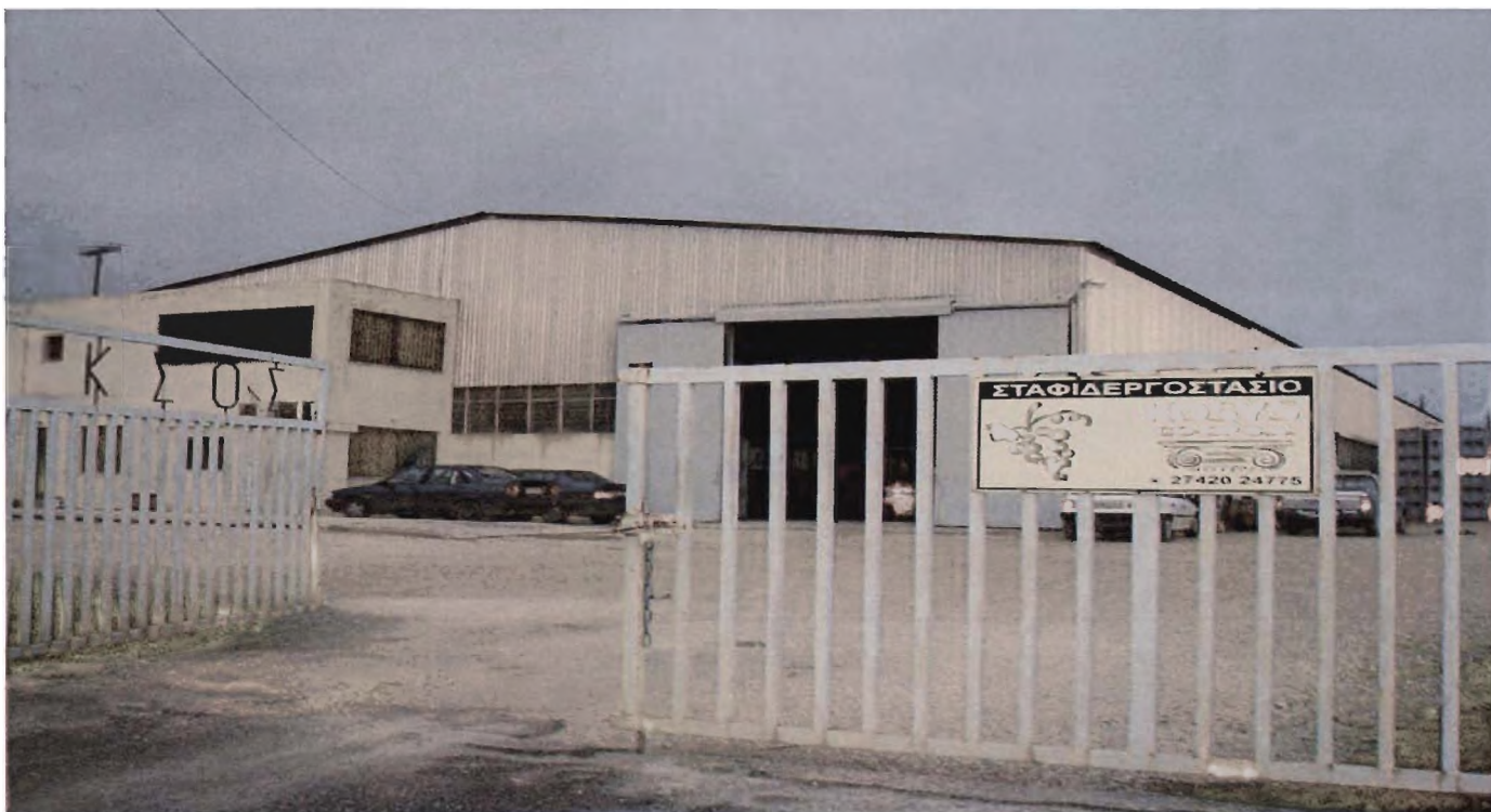
Εικόνα 5 ΚΟΣΥΣ Α.Σ.Ε.

Η διαδικασία παραλαβής πρώτης ύλης μπορεί να γίνει από τους ενώσεις αγροτικών συνεταιρισμών και μπορεί να αποθηκευτούν στους χώρους των ενώσεων και εν συνεχεία να μεταφερθούν στο εργοστάσιο ΚΟΣΥΣ ή ο κάθε μεμονωμένος παραγωγός να την φέρει κατευθείαν στο εργοστάσιο ΚΟΣΥΣ.