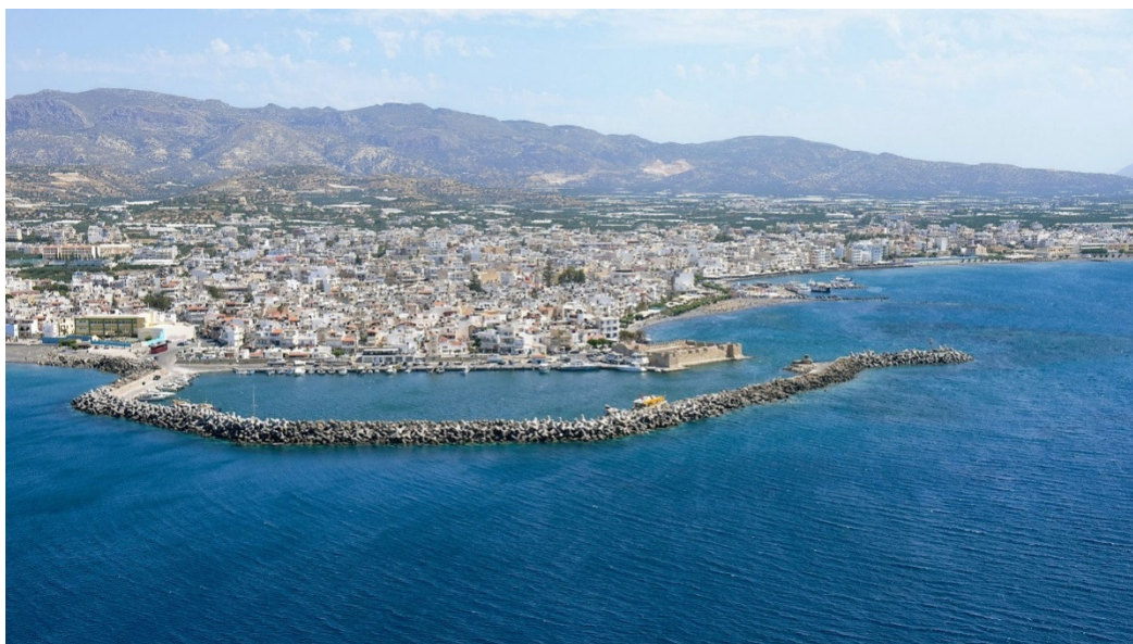
Πανοραμική άποψη της πόλης της Ιεράπετρας.

Άποψη παρόμοιας ξενοδοχειακής μονάδας για το πως θα διαμορφωθεί η Hospitality.