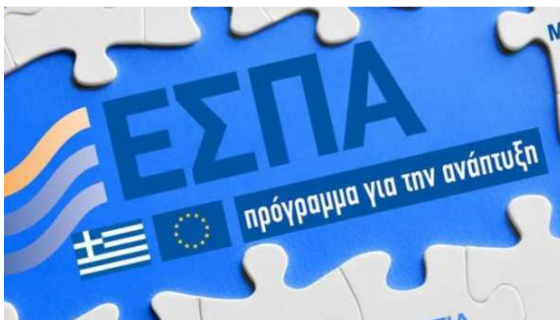
Πρόγραμμα ΕΣΠΑ (Εταιρικό Σύμφωνο για το Πλαίσιο Ανάπτυξης).