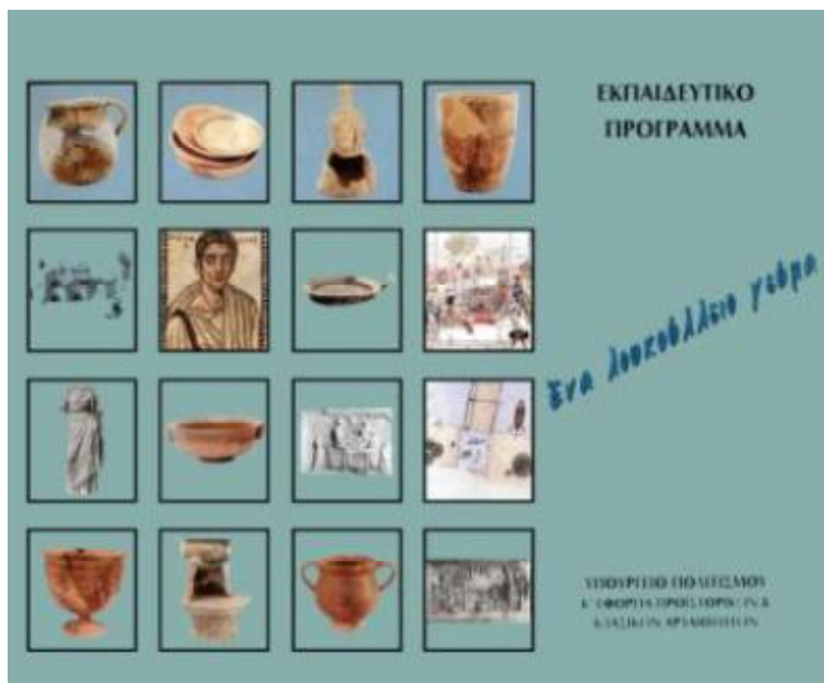
Εικόνα 4: Εκπαιδευτικό πρόγραμμα "Ενα λουκούλιο γεύμα"