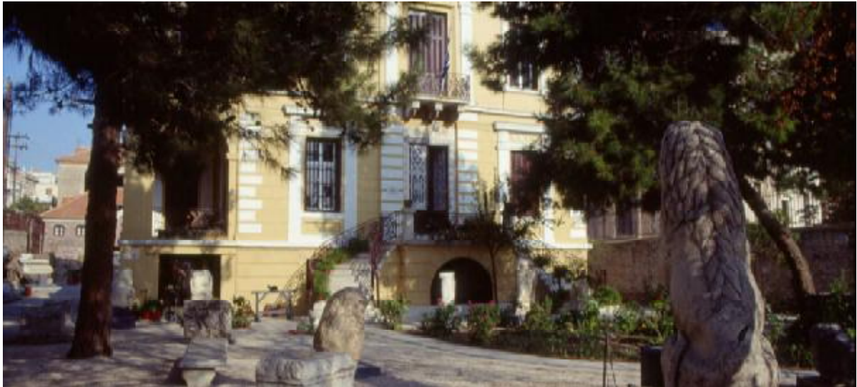
Εικόνα 1: Πρόσοψη του παλαιού Αρχαιολογικού Μουσείου Μυτιλήνης