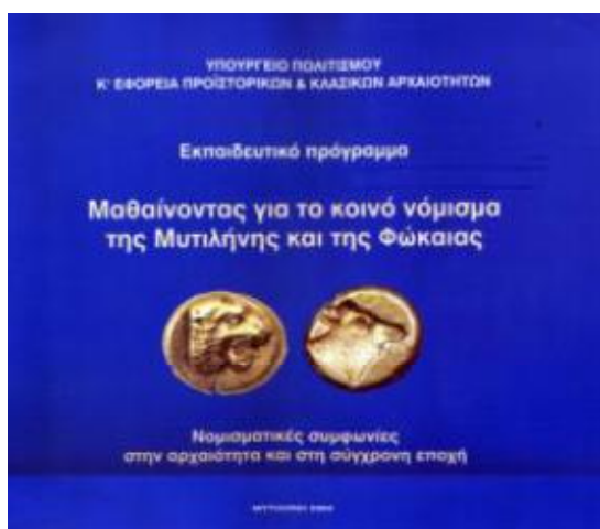
Εικόνα 5: Εκπαιδευτικό πρόγραμμα "Μαθαίνοντας για το κοινό νόμισμα της Μυτιλήνης και της Φώκαιας"