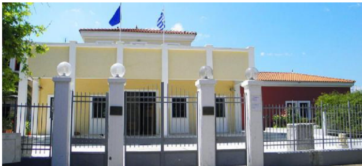
Εικόνα 3: Πρόσοψη νέου Αρχαιολογικού Μουσείου Μυτιλήνης