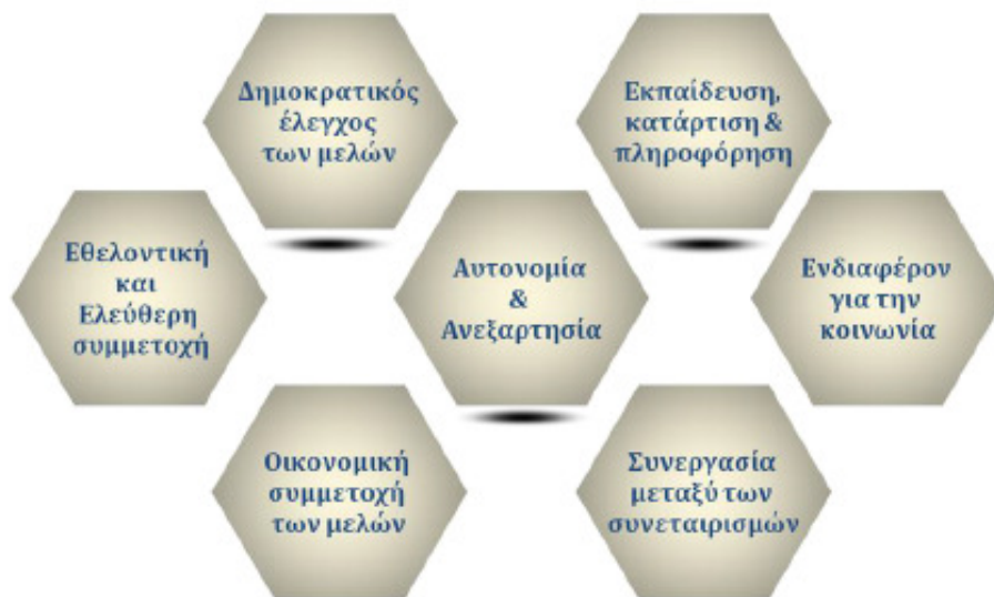
Εικόνα 1: Οι Συνεταιριστικές Αρχές