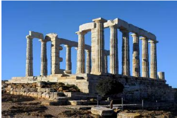
Εικόνα 1.Ο Ναός του Ποσειδώνα στο Σούνιο.

αναστήλωση πραγματοποιήθηκε με απευθείας υποδείξεις στα συνεργεία. Το τελικό αποτέλεσμα είναι πολύ πιο πλούσιο και διδακτικό, ενώ τα όποια λάθη είναι δυνατόν να επανορθωθούν.