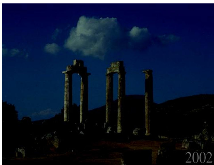
Εικόνα 7. Ο Ναός του Διός κατά το πρώτο διάστημα αναστήλωσης το 2002.

Πριν από την έναρξη του Προγράμματος Αναστήλωσης λοιπόν ήταν απαραίτητη η συστηματική καταγραφή αυτού του διάσπαρτου υλικού που πραγματοποιήθηκε από τον καθηγητή Frederick Cooper του Πανεπιστημίου της Minnesota κατά τα έτη 1980-1982. Το πρόγραμμα αναστήλωσης του Ναού του Δία ξεκίνησε το 1984 από τον καθηγητή Stephen Miller αλλά, ελλείψει πόρων, σε λίγους μήνες εγκαταλείφθηκε. Το 1999 το σχέδιο ξεκίνησε πάλι, δυναμικά αυτήν την φορά και ολοκληρώθηκε από την διεύθυνση της καθηγήτριας Kim Shelton του πανεπιστημίου του Berkeley. Τελικά η αναστήλωση των δύο πρώτων κίωνων πάνω σε αυτό το κρηπίδωμα, ξεκίνησε το 1999 και ολοκληρώθηκε με επιτυχία το καλοκαίρι του 2002. Ο ναός του Διός μετρούσε πλέον πέντε όρθιους κίονες και το αποτέλεσμα ήταν εντυπωσιακό! ( www.nemeangames.gr )