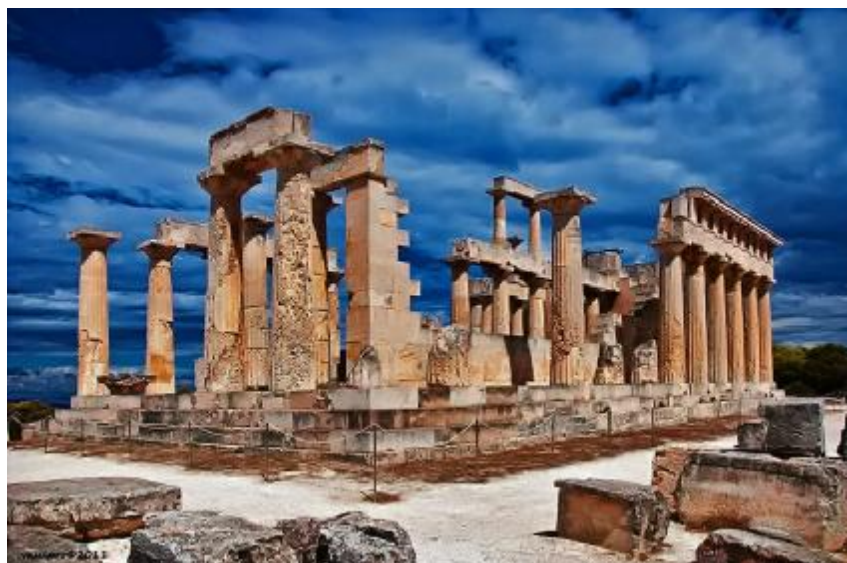
Εικόνα 2.Ναός Αιφάιας Αθηνάς στην Αίγινα.

Ένα παράδειγμα την εποχή 1959-1960 είναι η αναστήλωση του ναού της Αφάιας Αθηνάς στην Αίγινα που θεωρείται το τολμηρότερο έργο της εποχής. Με διάσπαρτα γύρω από τον ναό αρχιτεκτονικά μέλη, αλλά και με προσθήκη νέου υλικού, συμπληρώθηκε το διάζωμα της πρόσοψης και τμήματος της νότιας πλευράς στην οποία μάλιστα προστέθηκε το υπερκείμενο γείσο. Οι ορθοστάτες και τμήματα σήκου υψώθηκαν έτσι ώστε να γίνει σαφές το σχήμα του, αλλά και να τοποθετηθεί στη θέση του ένα υπέρθυρο. Τέλος, συμπληρώθηκε η βόρεια εσωτερική κιονοστοιχία και μάλιστα με μερικούς από τους κίονες της άνω σειράς.