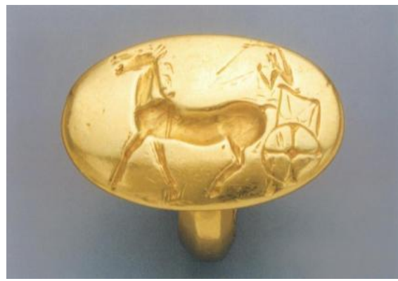
Εικόνα 12..Χρυσό δαχτυλίδι-σφραγίδα. Είναι από τα κλεμμένα του αρχαίου νεκροταφείου των Αηδονίων, 1500 π.Χ.