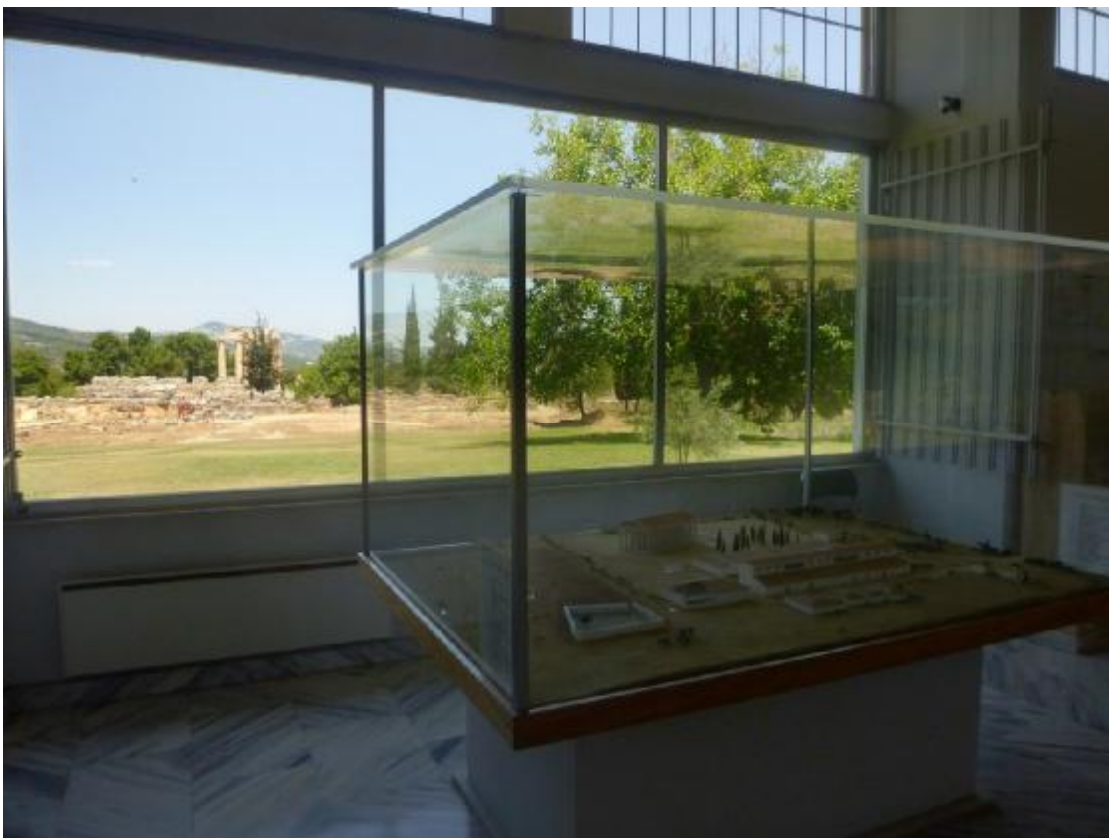
Εικόνα 32. Το εσωτερικό του μουσείου με φόντο τον αρχαιολογικό χώρο της Νεμέας. Στο Βάθος διακρίνετε ο Ναός του Διός. Αυτό το παράθυρο συνδέει την άμεση οπτική επαφή της μακέτας αναπαράστασης με τον Αρχαιολογικό χώρο.

Ο Αρχαιολόγος Miller, όπως αναφέραμε και προηγουμένως, στα μελλοντικά σχέδια της ανάδειξης περιλαμβάνει και τη δημιουργία της σχολής αρχαίου ελληνικού αθλητισμού στον αρχαιολογικό χώρο. Κάτι τέτοιο θα ήταν πολύ εποικοδομητικό και σπουδαίο για τους επισκέπτες αλλά και για τους ανθρώπους που θα θελήσουν να διδαχθούν την ιστορία αλλά και να την βιώσουν. Ωστόσο αν κάτι τέτοιο δεν είναι εφικτό ακόμα, με τις πρακτικές που προαναφέραμε, θα μπορούσε η Νεμέα να αναδειχτεί και να δημοσιοποιηθεί ώστε να προσελκύσει το ενδιαφέρον των επισκεπτών καθ' όλη την διάρκεια του χρόνου. Με τον τρόπο αυτό διατηρείται και προάγεται η πολιτιστική κληρονομιά.