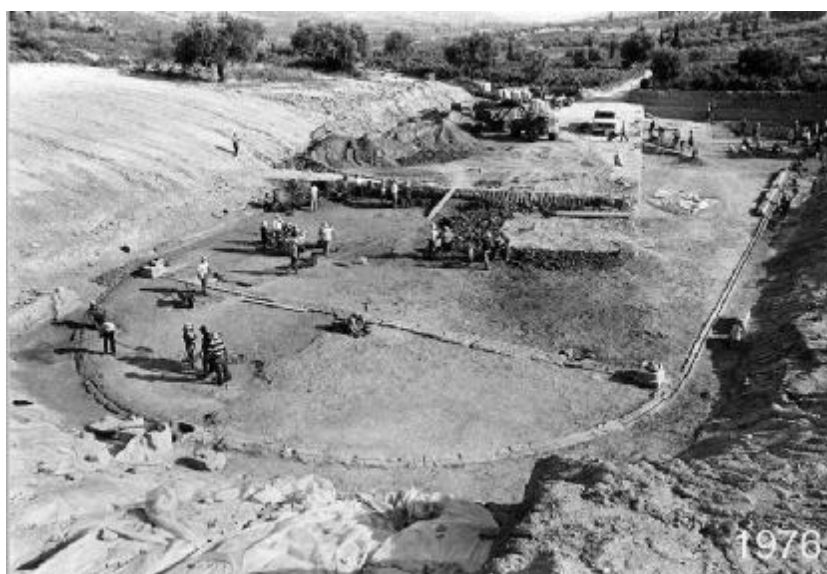
Εικόνα 29. Οι ανασκαφές του Σταδίου της Νεμέας το 1976.