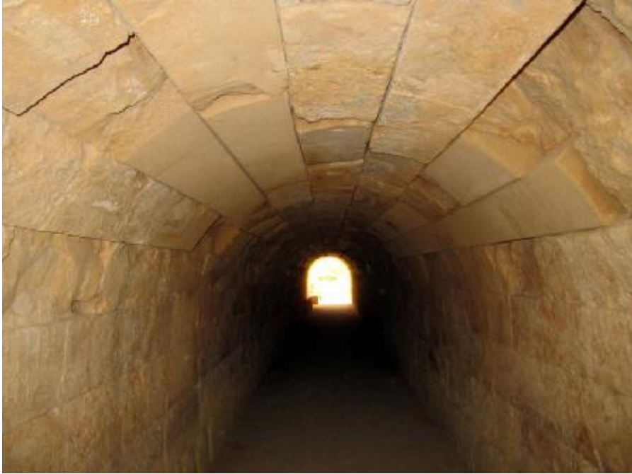
Εικόνα 5. Η κρύπτη είσοδος που οδηγεί στο στάδιο.

σύμβολα του αρχαίου κόσμου. Ποτέ δεν είχε γίνει η υπόθεση ότι μια τέτοια στοά θα μπορούσε να αποκαλυφθεί στη Νεμέα, μιας και ήταν επιβεβαιωμένο ότι η στοά της Ολυμπίας -τουλάχιστον στη σωζόμενη μορφή της- χρονολογείται στη ρωμαϊκή εποχή. Ωστόσο πριν από 40 χρόνια επικρατούσε η βεβαιότητα ότι οι αρχαίοι Έλληνες αγνοούσαν και δεν χρησιμοποιούσαν την τεχνική των θολωτών κατασκευών στην αρχιτεκτονική τους. ( www.nemeangames.org/el ).