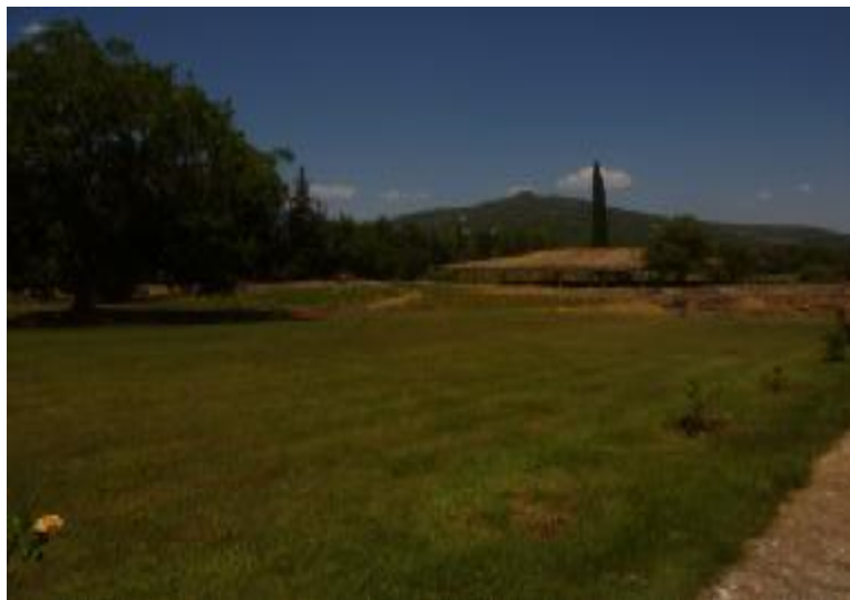
Εικόνα 19. Το άλσος που βρίσκεται μέσα στον αρχαιολογικό χώρο.