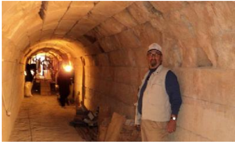
Εικόνα 31. Ο Αρχαιολόγος Stephen Miller κατά την διάρκεια των εργασιών της αναστήλωσης στη στοά του Σταδίου.

Η αναβίωση των αγώνων στο αρχαίο στάδιο ήταν όνειρο του Μένιου που είχε υποσχεθεί ο Μίλλερ. Μετά την ολοκλήρωση των ανασκαφών, σειρά είχε η δημοσίευση του σταδίου και η διαμόρφωση του περιβάλλοντα χώρου του.