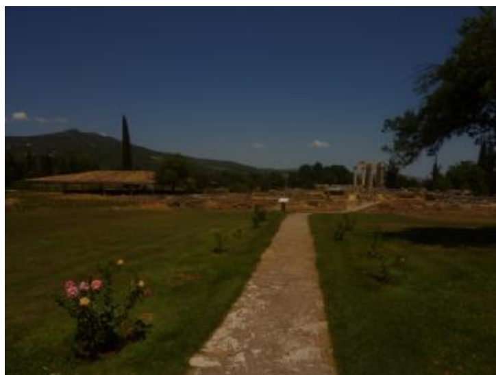
Εικόνα 20. Ο αρχαιολογικός χώρος. Στα δεξιά είναι ο Ναός του Νέμειου Διός και στα αριστερά τα λουτρά που είναι σκεπασμένα με ένα σύγχρονο στέγαστρο.