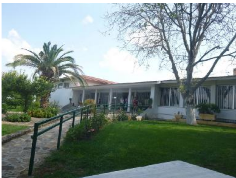
Εικόνα 3. Η είσοδος του αρχαιολογικού χώρου και το μουσείο εξωτερική πλευρά .Πηγή: από διαδίκτυο http://www.in-korinthia.com/company/arxaiologiko-mouseio-nemeas/

Αμερικάνικης Σχολής Κλασικών Σπουδών στην Αθήνα και με την άδεια και επίβλεψη της Αρχαιολογικής Υπηρεσίας του Υπουργείου Πολιτισμού της Ελληνικής Δημοκρατίας. Διευθυντής αυτών των ανασκαφών ήταν ο Καθηγητής Στέφανος Μίλλερ, ο οποίος πλέον έχει συνταξιοδοτηθεί. Ανασκαφές γύρω από το ιερό έγιναν το 1884 από ομάδα Γάλλων και επαναλήφθηκαν τα έτη 1924-1926, 1962 και 1964 από την Αμερικάνικη Σχολή Κλασικών Σπουδών στην Αθήνα, με εν μέρει χρηματοδότηση από το πανεπιστήμιο του Σιντσινάτι. Οι εργασίες του Μπέρκλεϊ χρηματοδοτήθηκαν με ιδιωτικές χορηγίες από τις Η.Π.Α, εκτός από εκείνες της αναστήλωσης του Ναού που ξεκίνησαν από τις Η.Π.Α αλλά στη συνέχεια χρηματοδοτήθηκαν από ιδιωτικές πηγές στην Ελλάδα. 1