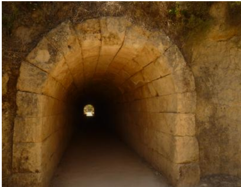
Εικόνα 24. Η «ΚΡΥΠΤΗΝ ΕΙΣΟΔΟΣ». Νεμέα.