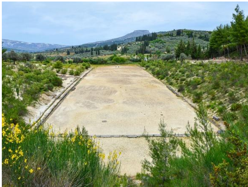
Εικόνα 28. Το αρχαίο στάδιο της Νεμέας από ψηλά.