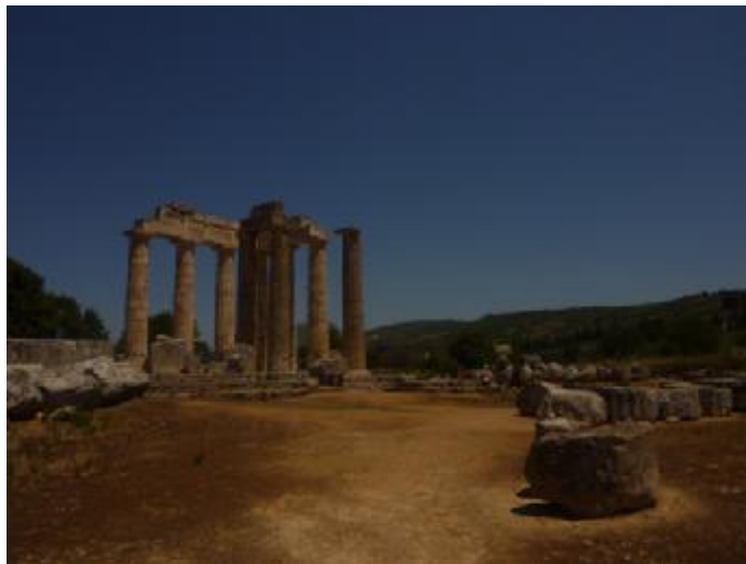
Εικόνα 6. Ναός του Νεμείου Διός.

Ο ναός του Νεμείου Διός βρίσκεται στο κέντρο του Ιερού του Διός, που περιελάμβανε μια σειρά από κτίρια και μνημεία, τα οποία χρησιμοποιούνταν για τις λατρευτικές και αθλητικές εκδηλώσεις των αρχαίων αγώνων. Κυριότερα ήταν ο επιμήκης βωμός ανατολικά του ναού. Εδώ οι αθλητές και οι προσκυνητές έφερναν ζώα για να τα θυσιάσουν στο Δία και να πραγματοποιηθούν οι προσευχές τους. Για αυτό και πρέπει να διευκρινιστεί ότι ο Νέμειος Δίας δεν ταυτίζεται με τον Ολύμπιο Δία, καθώς ο θεός του ναού της Νεμέας ήταν σύμβολο της ταυτότητας της κοιλάδας, της κτηνοτροφίας και των βοσκών. (Μίλλερ, 2005: 91).