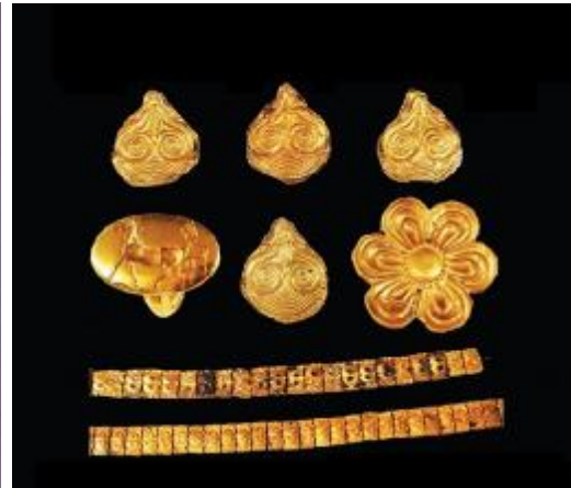
Εικόνα 11. Από την συλλογή των κλεμμένων κοσμημάτων που τώρα βρίσκονται στο μουσείο της Νεμέας.