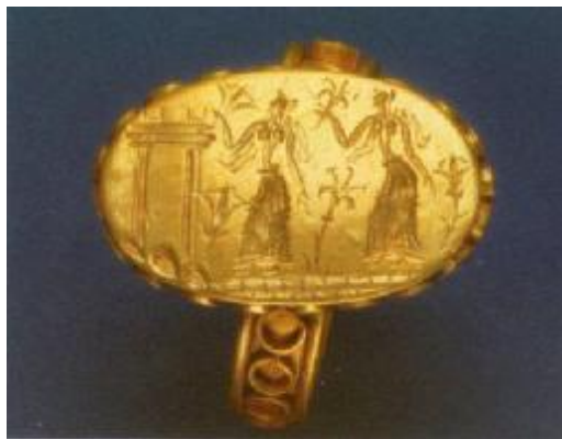
Εικόνα 13. Χρυσό δαχτυλίδι ,εκτίθεται στο μουσείο Νεμέας, 1500 π.Χ.