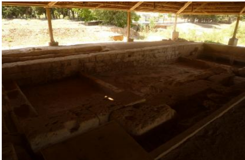
Εικόνα 22. Τα λουτρά των αθλητών.