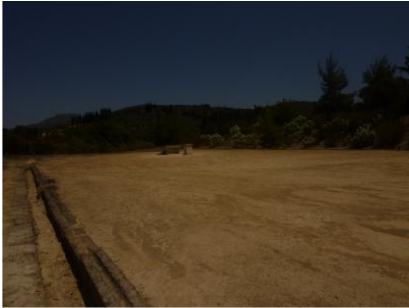
Εικόνα 27. Το στάδιο της Νεμέας από την δεξιά του πλευρά.