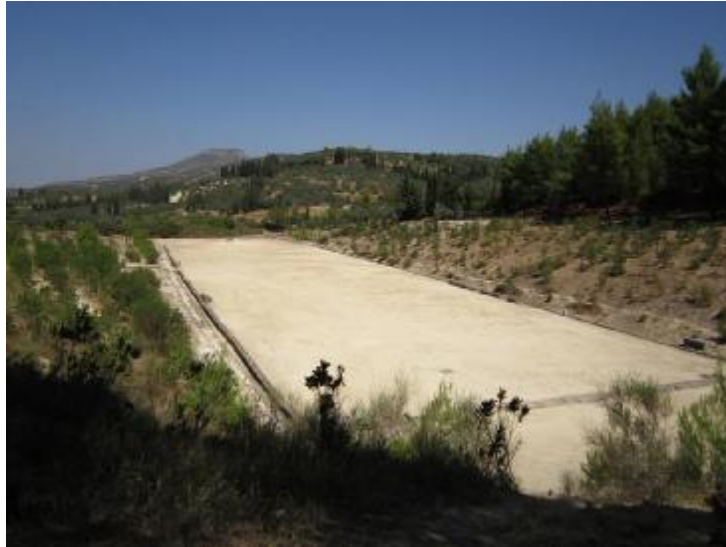
Εικόνα 4. Το στάδιο.

Οι ανασκαφές και η έρευνα έχουν δείξει με βεβαιότητα ότι το Στάδιο κατασκευάστηκε το 330-320 π.Χ. Περίπου χρησιμοποιήθηκε μόνον ως μεταφορά των αγώνων στο Άργος το 271 π.Χ. Μετέπειτα μαρτυρείται ποικίλη αγροτική δραστηριότητα κατά τον 1ο αιώνα π.Χ. Η αθλητική χρήση του Σταδίου περιορίστηκε σε 60 χρόνια περίπου (330-370 π.Χ.) και επομένως, το Στάδιο παρουσιάζει μια εικόνα <<παύσης>> των αγώνων και της λειτουργίας των αθλητικών εγκαταστάσεων στις αρχές της ελληνιστικής εποχής. Το στάδιο χωρητικότητας περίπου 40.000 θεατών, κατασκευάστηκε στο πλαίσιο του προγράμματος επιστροφής των Αγώνων στη Νεμέα περί το 335 π.Χ. Εδώ γίνονταν κάθε δύο χρόνια τα Νέμεα, πανελλήνιοι αγώνες προς τιμήν του Οφέλη και αφιερωμένοι στο Δία. Οι αγώνες περιελάμβαναν δρόμους των 200, 400 και 5000 μέτρων, πάλη, πυγμαχία, παγκράτιο (μια πάλη ουσιαστικά χωρίς λαβές) και το κλασικό πένταθλο (δρόμος 200 μ., ακοντισμός, δισκοβολία, άλμα εις μήκος και πάλη). 0 μέτρων νοτιοανατολικά του Ναού του Διός. ( www.opheltes.gr )