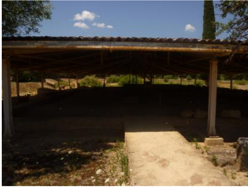
Εικόνα 21. Τα λουτρά του αρχαιολογικού χώρου σκεπασμένα με ένα σύγχρονο στέγαστρο.