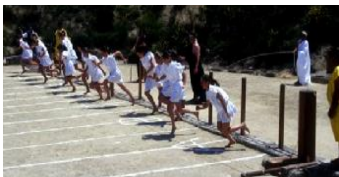
Εικόνα 17. Μικρά παιδιά συμμετέχουν στην αναβίωση των Νέμεων Αγώνων 2012.