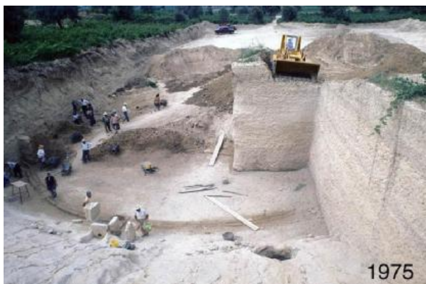
Εικόνα 30 Η ανασκαφή του Σταδίου το 1975.