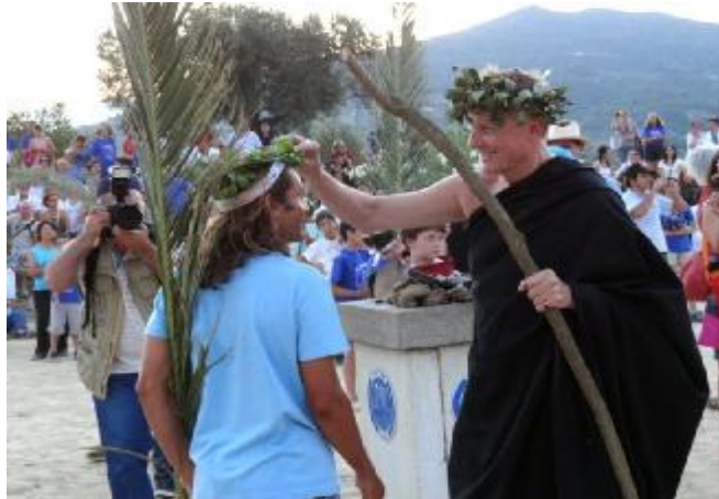
Εικόνα 18. Αναβίωση των Νέμεων αγώνων 2012.