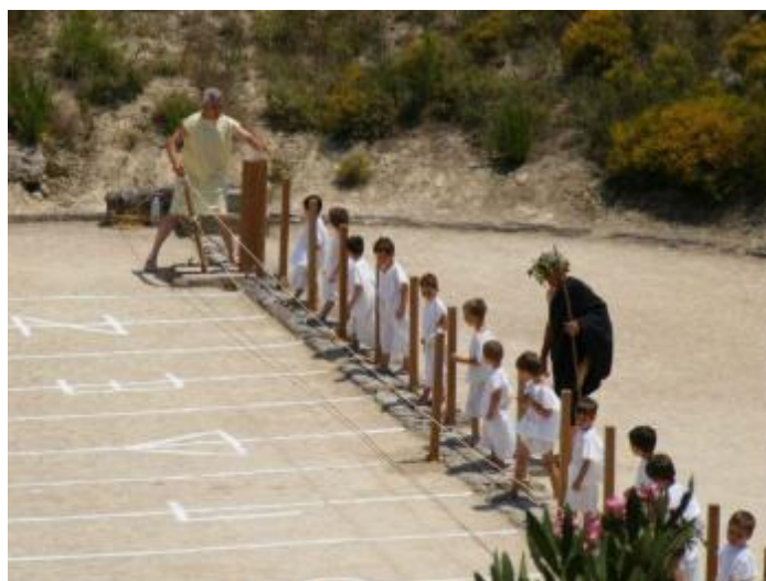
Εικόνα 16. Αναβίωση των Νέμεων αγώνων 2012.