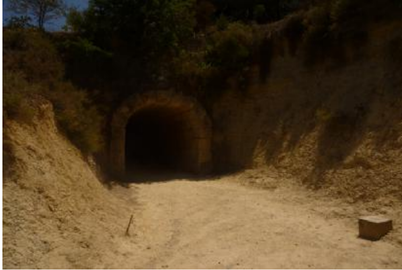
Εικόνα 25. Η «ΚΡΥΠΤΗΝ ΕΙΣΟΔΟΣ» πριν από την είσοδο του στο στάδιο της Νεμέας.