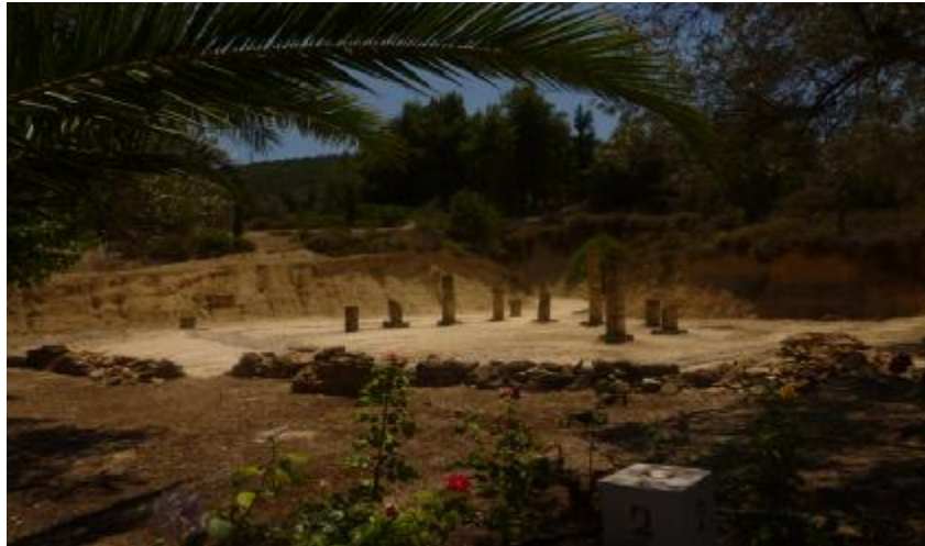
Εικόνα 23. Τα αποδυτήρια των αθλητών πριν μπουν στην «ΚΡΥΠΤΗΝ» είσοδο.