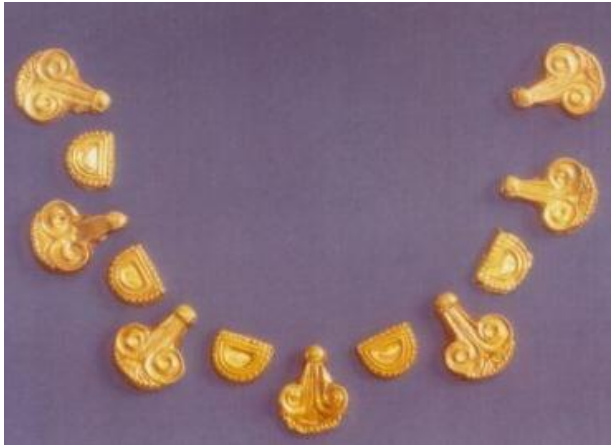
Εικόνα 10. Κοσμήματα από τους τάφους των Αηδονίων.