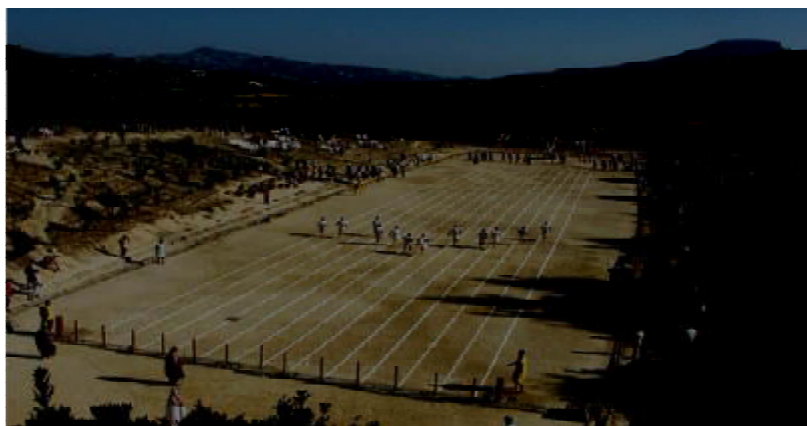
Εικόνα 15. Η αναβίωση των Νέμεων αγώνων το 2012.

άμεση επαφή με την αρχαία ιδέα και το αρχαίο πνεύμα που ακόμα ζει στην γη της Νεμέας. (Μίλλερ, 2013)