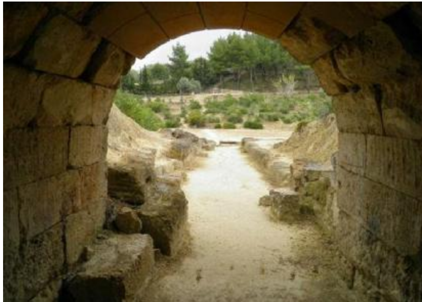
Εικόνα 26. Η «ΚΡΥΠΤΗΝ ΕΙΣΟΔΟΣ» στην έξοδο της και το στάδιο μπροστά.