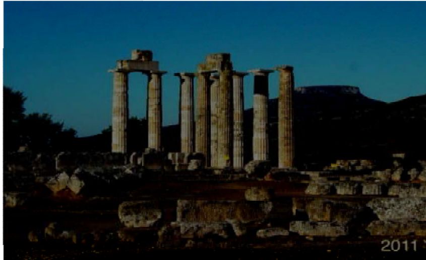
Εικόνα 9. Ο Ναός του Διός και η αναστήλωση το 2011.