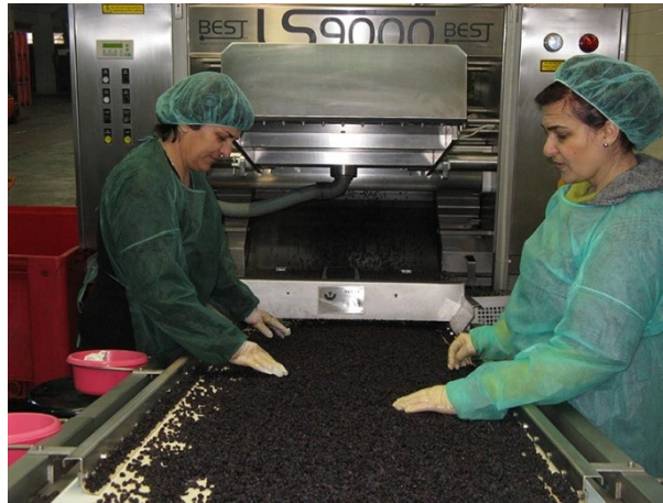
Εικόνα 4.2: Σταφιδεργοστάσιο της Ένωσης Αγροτικών Συνεταιρισμών Ζακύνθου.

διαφορετικούς τύπους, μικρή και μεσαία. Επίσης, το εμπόρευμα μπορεί να αποσταλεί σε συσκευασία χαρτοκιβωτίου της επιλογής του πελάτη όπως χαρτοκιβώτια των 10 ή 12,5 κιλών.