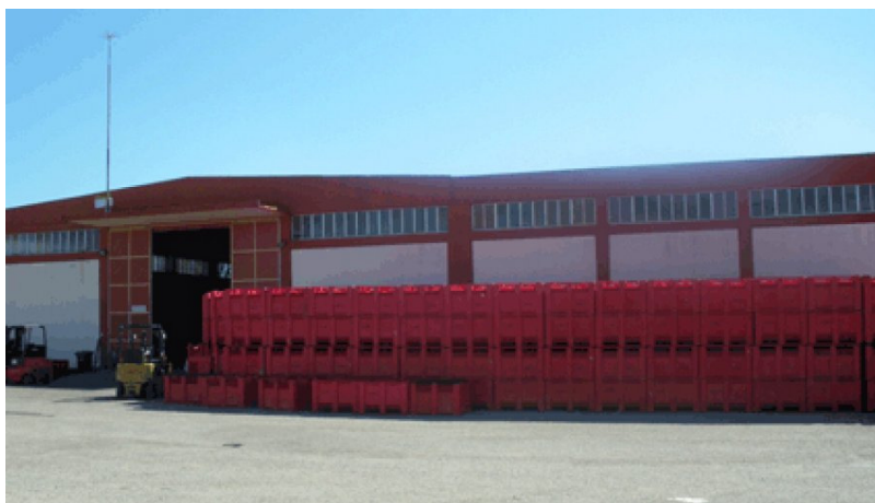
Εικόνα 4.3: Σταφιδεργοστάσιο της Ένωσης Αγροτικών Συνεταιρισμών Ηλείας – Ολυμπίας 10 .

Με μια ανοδική πορεία, η ΕΑΣ Ηλείας-Ολυμπίας πλέον αριθμεί 20.000 μέλη και αποτελεί μία από τις μεγαλύτερες Συνεταιριστικές Οργανώσεις στην Ελλάδα.