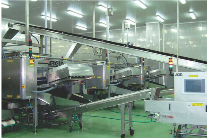
Εικόνα 4.1: Σύγχρονες παραγωγικές εγκαταστάσεις της ΕΑΣ Αγίου.