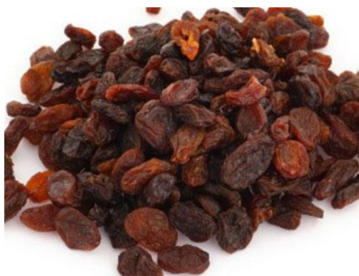
Εικόνα 1.3: Σταφίδα.

Τα πιο δημοφιλή είδη σταφίδας είναι η σουλτανίνα, η σταφίδα Μάλαγα, η σταφίδα Μονukka, η σταφίδα Ζακύνθου, η κορινθιακή σταφίδα, η σταφίδα Μοσχάτο και η σταφίδα Thompson χωρίς κουκούτσια.