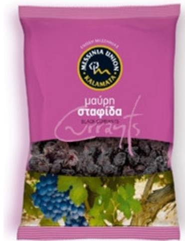
Εικόνα 4.4: Πρακτική συσκευασία Μαύρης Σταφίδας 11 Καλαμάτας.

Σήμερα η Ε.Α.Σ. Μεσσηνίας διαθέτει τρία σύγχρονα, ευρωπαϊκών προδιαγραφών τυποποιητήρια -συσκευαστήρια ελαιολάδου, ελιάς, και σταφίδας, τα οποία συνοδεύονται από διακριτούς στεγασμένους αποθηκευτικούς και βοηθητικούς χώρους. Επειδή η Ε.Α.Σ. Μεσσηνίας δίνει ιδιαίτερο βάρος στον τομέα των τροφίμων, έχει εγκαταστήσει πρότυπο χημείο πλήρως εξοπλισμένο. Το χημείο αυτό διαθέτει κατάλληλα εκπαιδευμένο προσωπικό, που είναι σε θέση να ανταπεξέλθει στις υψηλές απαιτήσεις που θέτουν σήμερα οι διεθνείς κανονισμοί σε θέματα ασφάλειας και ποιότητας τροφίμων.