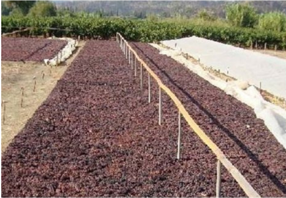
Εικόνα 1.2: Ξήρανση του καρπού.

Ο καρπός της μαύρης σταφίδας συνήθως συλλέγεται τον μήνα Αύγουστο από τους παραγωγούς και αποξηραίνεται σε ειδικά διαμορφωμένους υπαίθριους χώρους που ονομάζονται αλώνια. Έπειτα, ανάλογα με τον καιρό, από οκτώ ημέρες, την γυρίζουν για να αποξηρανθεί και από την άλλη όψη και μετά από 2-3 ημέρες τον «λαγανίζουν», δηλαδή βγάζουν τη ρόγα από το κοτσάνι και στη συνέχεια την μαζεύουν και την πηγαίνουν για επεξεργασία. Η επεξεργασία αυτή καλείται «μακινάρισμα». Με την επεξεργασία αυτή απορρίπτονται τα περιττά σώματα και τα «τσίγγανα» που ενδεχομένως έχει και ξεχωρίζεται η χοντρή από την ψιλή ρόγα. Έπειτα πωλείται στους σταφιδέμπορους και στις ενώσεις συνεταιρισμών και εκείνοι αναλαμβάνουν την περαιτέρω επεξεργασία, την συσκευασία της και την διάθεσή της στην εγχώρια και παγκόσμια αγορά.