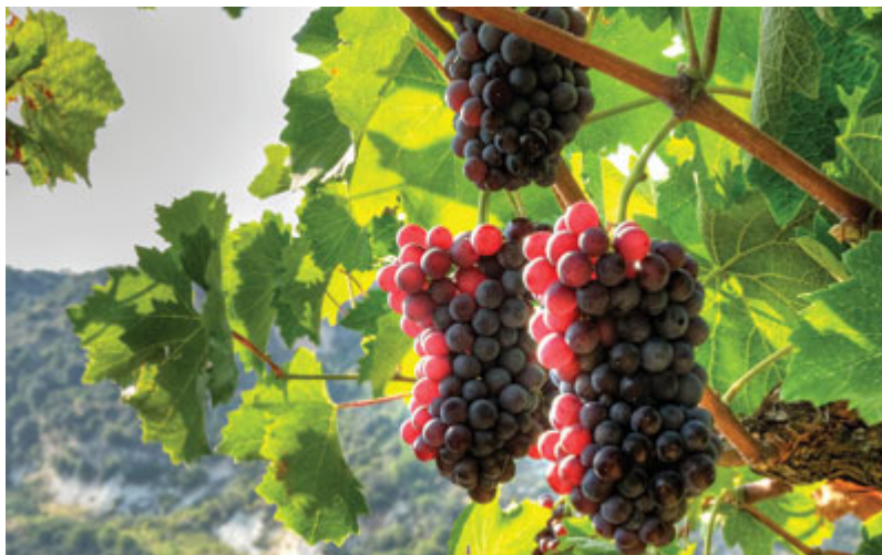
Εικόνα 1.1: Σταφύλι.

Το αποξηραμένο σταφύλι ονομάζεται σταφίδα (Εικόνα 1.1). Διακρίνεται σε δύο είδη, τη μαύρη και την άσπρη, η οποία λέγεται και σουλτανίνα. Τρώγεται σκέτη ως γλυκό και συνήθως προστίθεται σε κέικ και διάφορα γλυκά. Η κύρια διεργασία παραγωγής είναι η ξήρανση του καρπού (Εικόνα 1.2), κυρίως της μαύρης σταφίδας, στον ήλιο για περίπου 10 ημέρες, ενώ μετά μπορεί να χρησιμοποιηθούν ορισμένα πρόσθετα ώστε να βελτιωθεί η ποιότητα και να επεκταθεί ο χρόνος αποθήκευσης (Πιζάνιας, 1988).