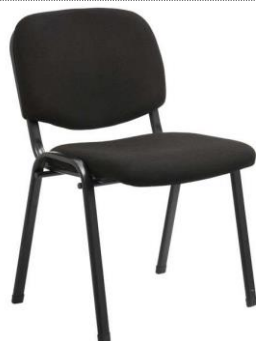
ΚΑΘΙΣΜΑ ΜΑΘΗΤΩΝ - ΕΠΙΣΚΕΠΩΝ