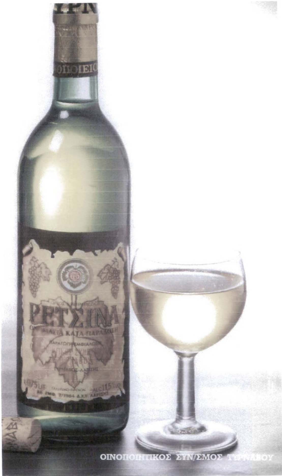
ΟΙΝΟΠΟΙΗΤΙΚΟΣ ΣΥΝ/ΣΜΟΣ ΤΥΡΝΑΒΟΥ