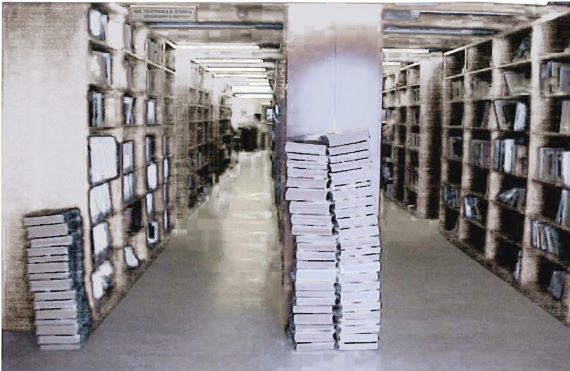
εικόνα 9 : Η βιβλιοθήκη του Τ.Ε.ι. Μεσολογγίου.