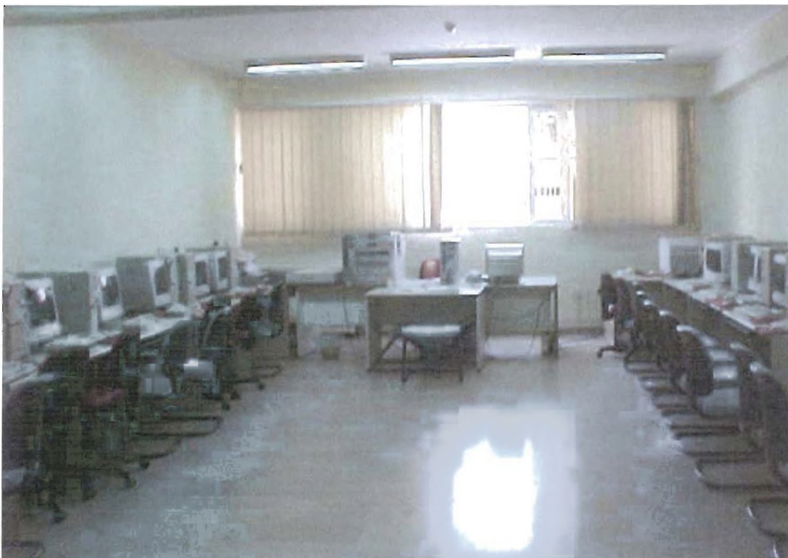
εικόνα 8 : Η αίθουσα του εργαστηρίου «Προγραμματισμού Η/Υ Ι,ΙΙ,ΙΙΙ»