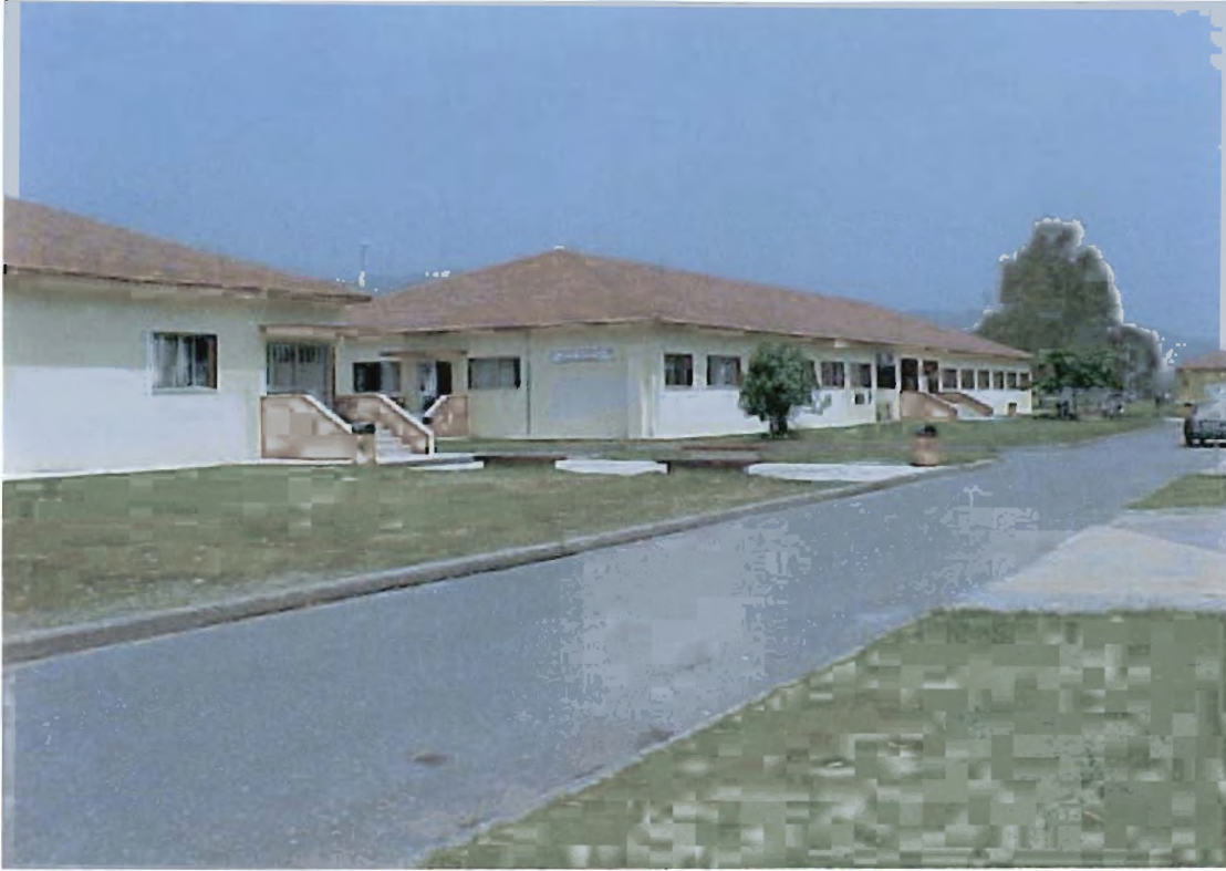
εικόνα 1: Η σχολή Σ.Δ.Ο. στην οποία στεγάζεται το τμήμα Σ.Σ.Ο.Ε.