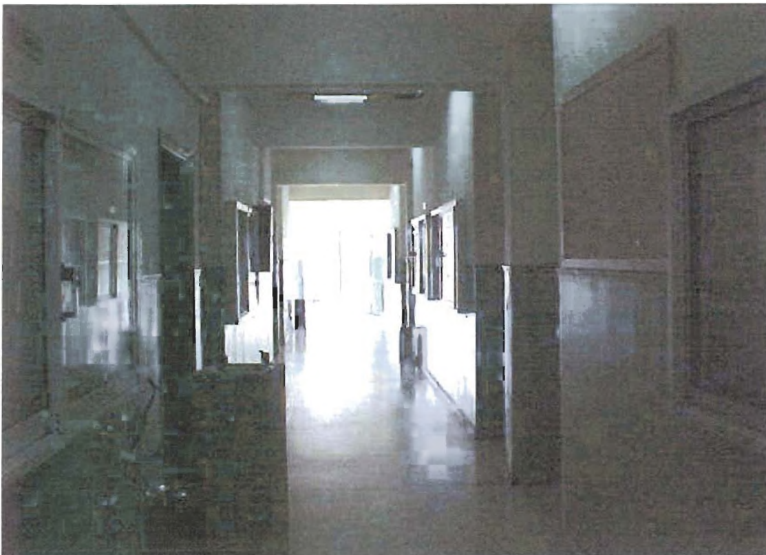
εικόνα 10: Ο διάδρομος του τμήματός μας.