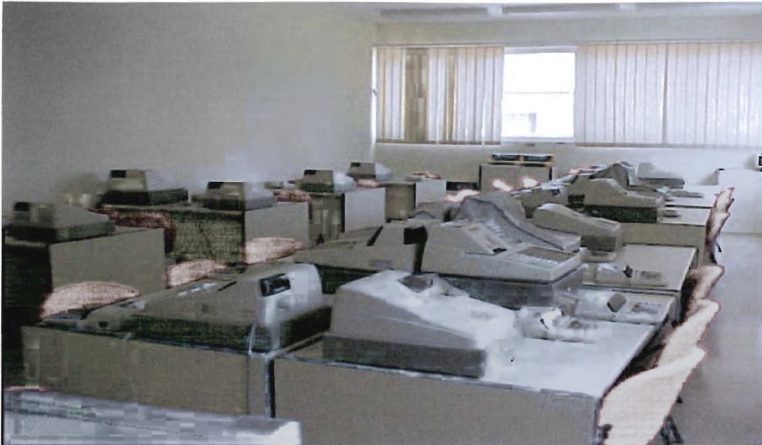
εικόνα 7 : Η αίθουσα του εργαστηρίου « Οργάνωση Γραφείου».