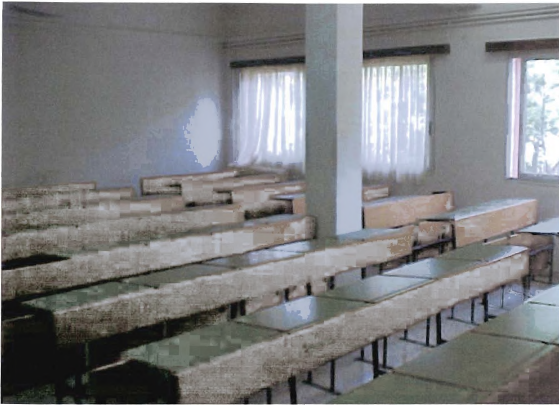
εικόνα 3: Αίθουσα του τμήματος Σ.Σ.Ο.Ε.