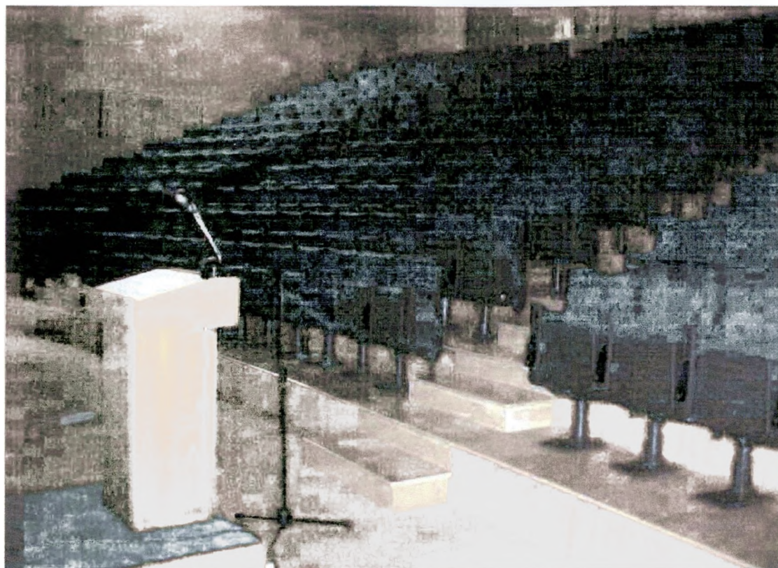
εικόνα 11 : Το Αμφιθέατρο του Τ.Ε.Ι/Μ.