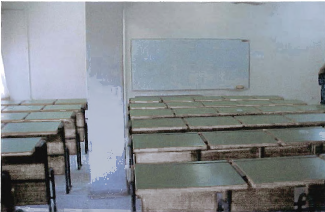
εικόνα 4 : Αίθουσα του τμήματος Σ.Σ.Ο.Ε.