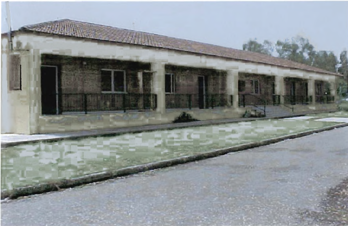
εικόνα 2 : Οι φοιτητικές εστίες του Τ.Ε.Ι Μεσολογγίου.