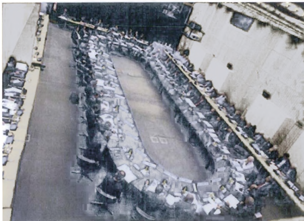
Εικόνα 3.2 Συνεδρίαση Ecofin στις Βρυξέλλες

Ο ευρωπαϊκός μηχανισμός θα διαθέτει 60 δις ευρώ μέσω δανείων από την Κομισιόν και 440 δις μέσω δανείων από τα κράτη μέλη του ευρώ. Τα επιτόκια των δανείων θα ακολουθήσουν τη «φόρμουλα» που έχει συμφωνηθεί για την Ελλάδα.