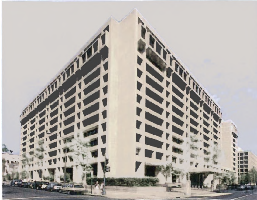
Εικόνα 3.1 Το κτήριο του Διεθνούς Νομισματικού Ταμείου

Κύριος σκοπός του εν λόγω οργανισμού είναι η προώθηση της διεθνούς νομισματικής συνεργασίας μεταξύ των κρατών-μελών με ισόρροπη ανάπτυξη του διεθνούς εμπορίου. Για τον σκοπό αυτό προωθούνται συγκεκριμένα μέτρα, ή οσάκις κρίνεται αναγκαίο αποφασίζονται ιδιαίτερα μέτρα, μεταξύ των οποίων είναι: