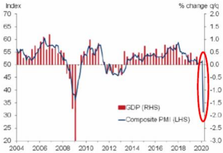
Γράφημα 2: Δείκτης Προμηθειών (PMI) Ευρωζώνης 2004-2020. (ΣΕΤΕ, 2020)